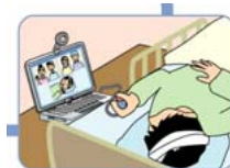
第 9 章 特別支援教育における教育の情報化