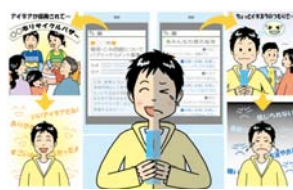
第 5 章 学校における情報モラル教育と家庭・地域との連携