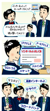
第 4 章 情報教育の体系的な推進