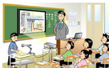
第 3 章 教科指導における ICT 活用